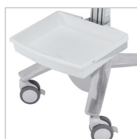
SV FRÄMRE BRICKA