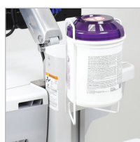
SV HÅLLARE FÖR SANITETSSERVETTER